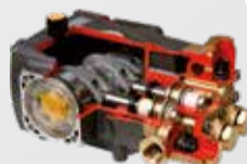
Bomba lineal y pistones cerámicos