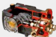
Bomba lineal y pistones cerámicos