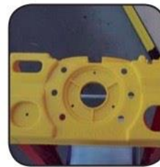
Detalle bandeja Détail tablette Detalhe bandeja