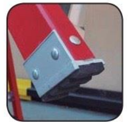
Detalle taco antideslizante Détail sabot antidérroage Detalhe taco antiderrapante