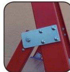
Detalle bisagra Détail charnière Detalhe dobradiça