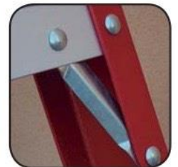
Detalle tirante refuerzo Détail renforcement Detalhe reforço